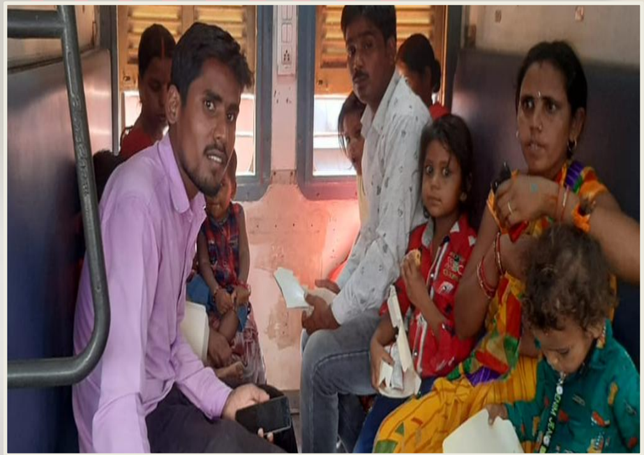
1. Children with parents going to Kanpur for treatment