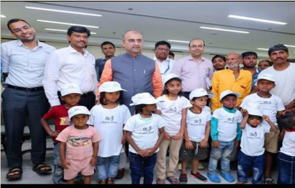
Group pic with officials