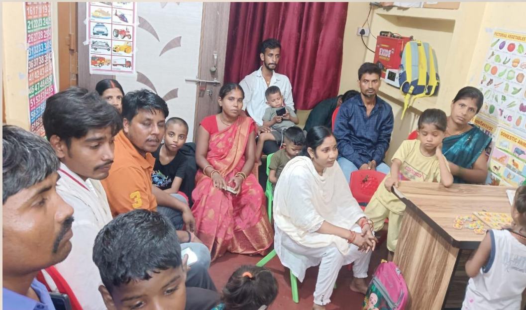
Speech therapy Sessions