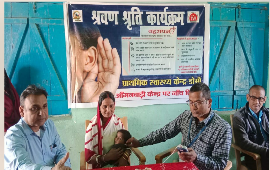
2. Screening of children at AWCs.