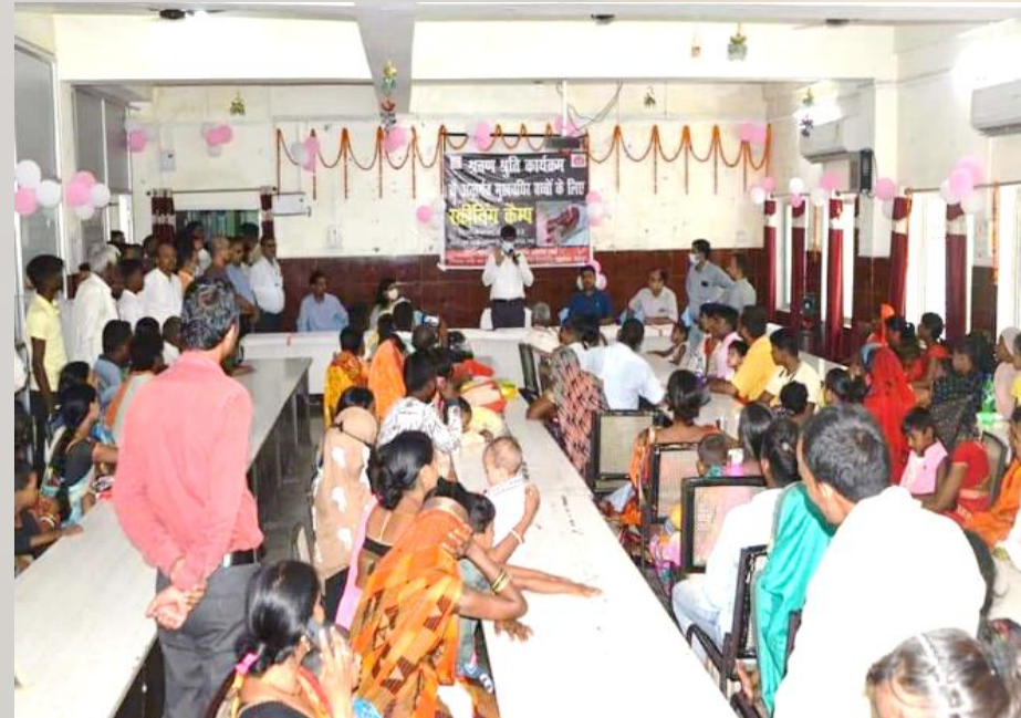
3. District level screening camps