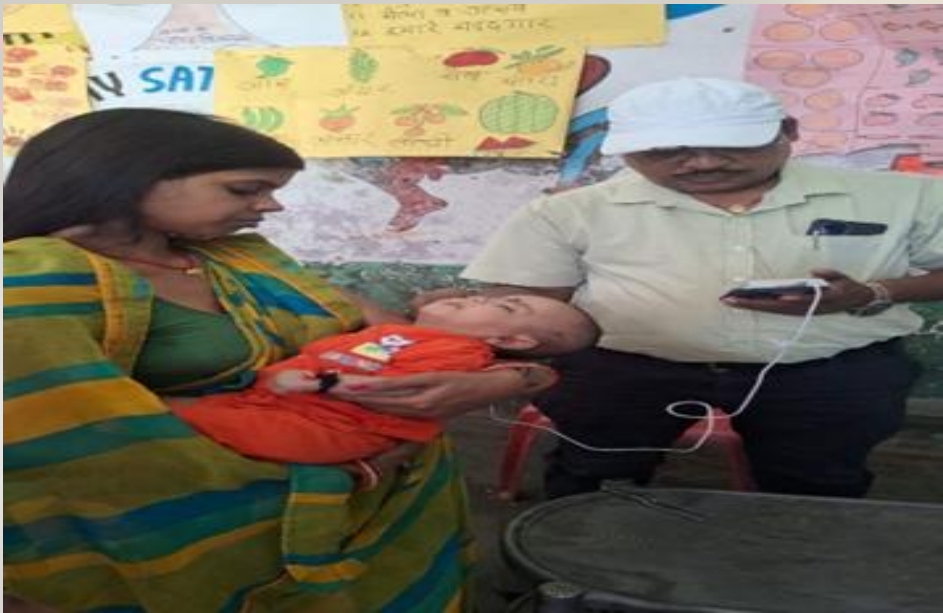
Screening of children at AWCs.